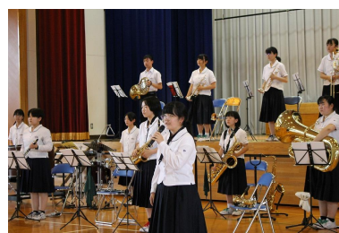
壮行会の場面より

7月8日(土)秋田県吹奏楽コンクール県北地区大会が、ほくしか鹿鳴ホールで行われました。これまでの練習の集大成として臨みました。結果は銅賞でした。たくさんの指導者の方からの助言や指導をいただき、自分たちの音楽を創り高めてきた過程は、消えることのない大きな財産です。ご支援ありがとうございました。