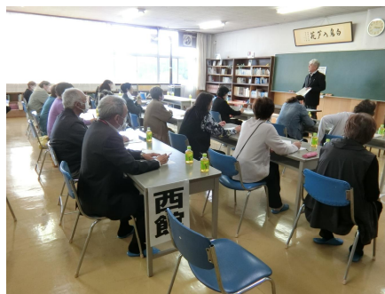
民生児童委員来校