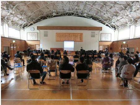
1年生『合同進路学習』

12月2日（土）、2学期のPTA授業参観では、たくさん保護者の方々にご来校いただきありがとうございました。実際に役立つ授業参観を目指し、各学年で2学期の今必要なことを実践を交えて見ていただきました。1年生では、『今からはじまっている進路選択』、2年生では、大館警察署の佐藤さんを講師に『薬物乱用防止教室』、3年生では、『面接の基本と家庭で練習できるポイント』の授業でした。授業の一場面を紹介します。