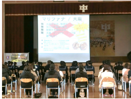
2年生『薬物乱用防止教室』