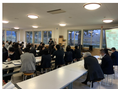
小中全体の研究会