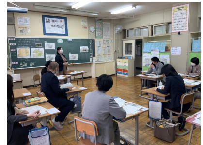
授業改善プロジェクト部会