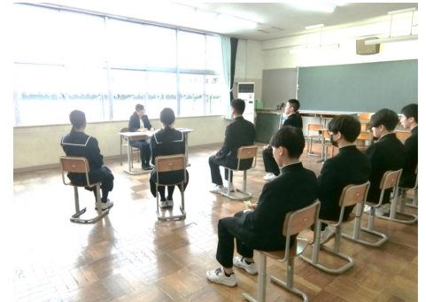
3年生『面接のポイント』